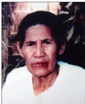
นางหงส์ (ภายหลังเปลี่ยนชื่อเป็น อิ่ง )